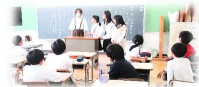
5・6年生：委員会活動

子どもの学びが深まり、心が豊かになるためには、子どもたち一人一人が生かされ、認め合う「支持的風土」が必要です。本校では、学級会や児童会活動などの児童の自主的な活動を通して、意見が異なる他者との合意形成を図る力や人間関係形成力を高めています。子どもたちが互いの立場や考え方を尊重し合い、違いを認めて協力しあえる集団づくりを進めています。