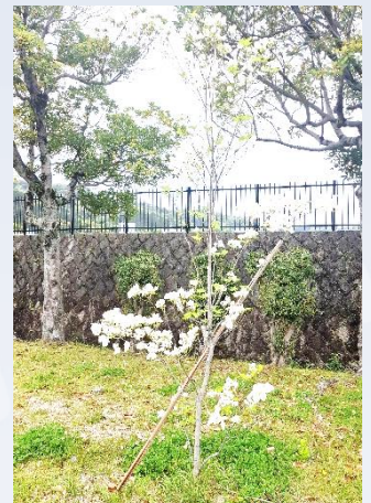
令和5年度、皇子山公園に 植樹したハナミズキ